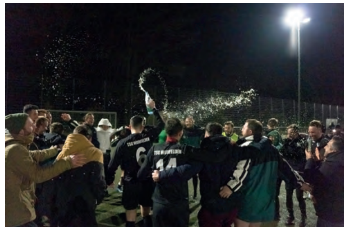
Der Jubel war groß: Pokal-Halbfinale erreicht!

Nach dieser Partie kam es dann zur großen Chance Worfelder Fußballgeschichte zu schreiben und gegen die SG Trebur-Astheim aus der Kreisliga A in das Halbfinale des Kreispokals einzuziehen. Nach einem starken und mannschaftlich geschlossenen Auftritt hieß es am Ende 3:1 für die TSG und der Jubel kannte keine Grenzen mehr. Zum ersten Mal zieht eine Worfelder Mannschaft in das Halbfinale des Pokals ein und trifft dort am 18.04 in einem Heimspiel auf den Hessenligist VfB Ginsheim.