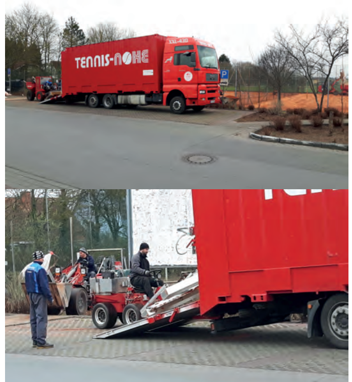
Impressionen Aufbereitung der Tennisplätze

Vereins- und Versammlungsstätten können geöffnet werden. Zuschauer im Freien sind nach der 3 G Regel erlaubt.