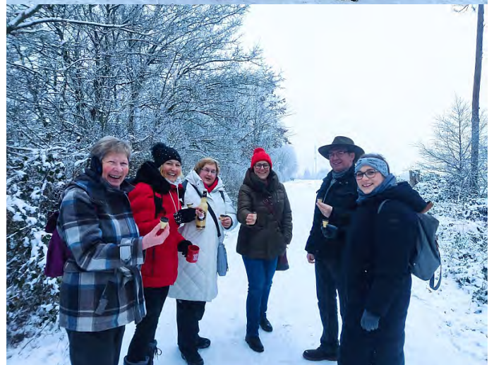
Impressionen von der Winterwanderung