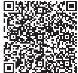
Spielplan 2. Mannschaft